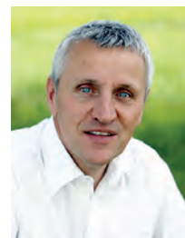
von Manfred Dreiling