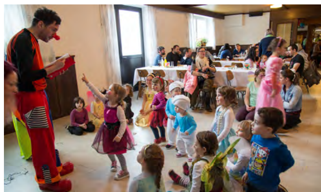
Lustiges Treiben beim Kinderfasching

Unsere nächste Veranstaltung wird ein gemeinsames Backen zum Muttertag bzw. Vatertag sein. Genauere Informationen dazu erhalten die Kinder in Kürze.