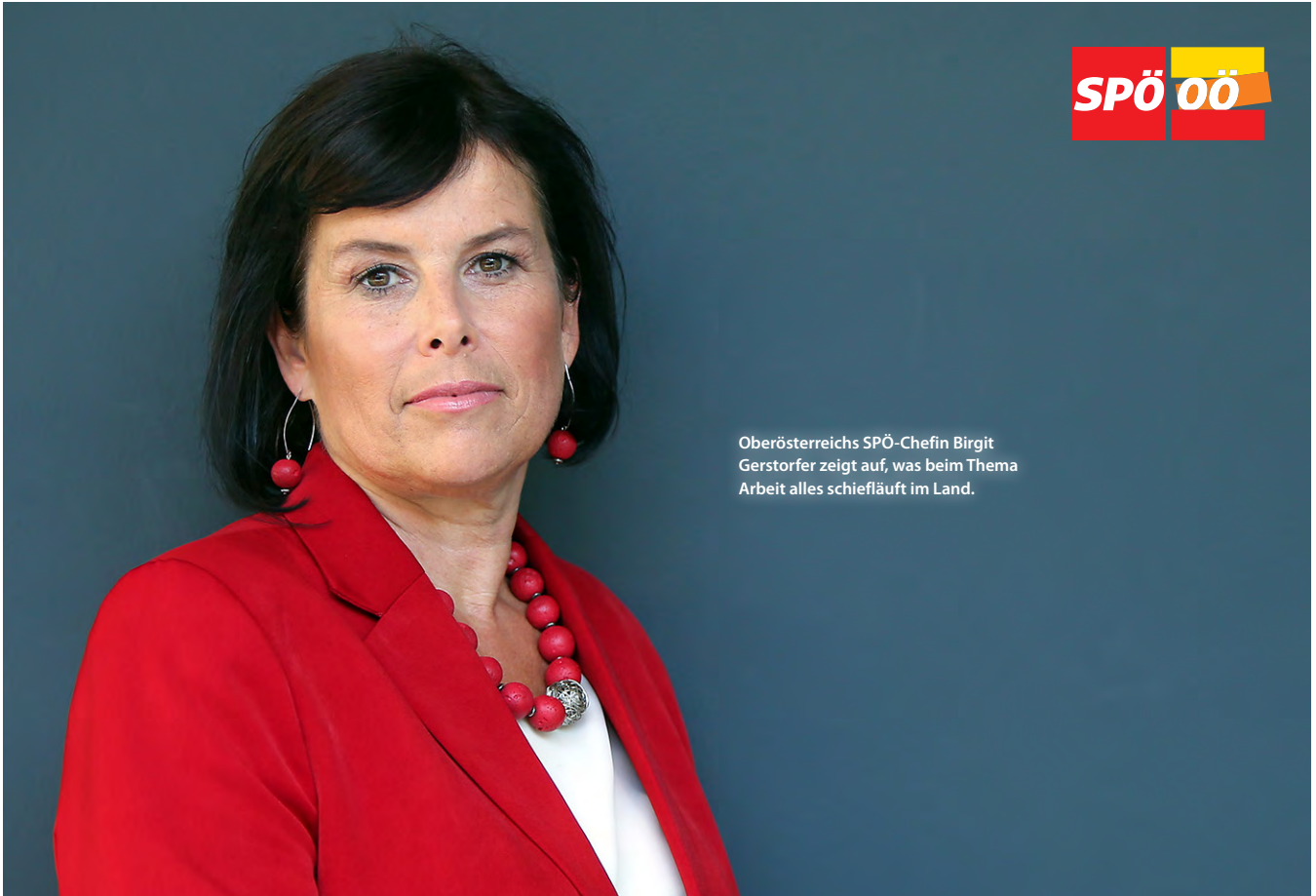
Oberösterreichs SPÖ-Chefin Birgit Gerstorfer zeigt auf, was beim Thema Arbeit alles schief läuft im Land.

SPÖ-LANDESPARTEIVORSITZENDE BIRGIT GERSTORFER KRITISIERT BUNDESREGIERUNG