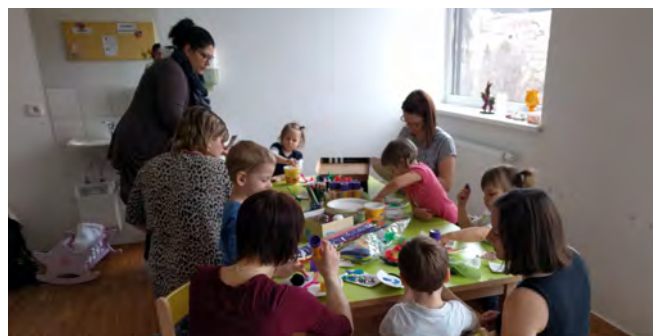
Spiel und Spass beim Eltern-Kind-Treff