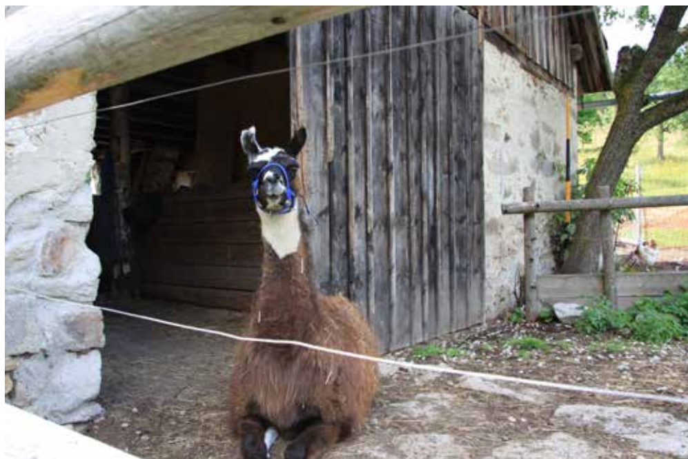
Die Kamele waren die Stars bei der Ferienpassaktion der Gesunden Gemeinde