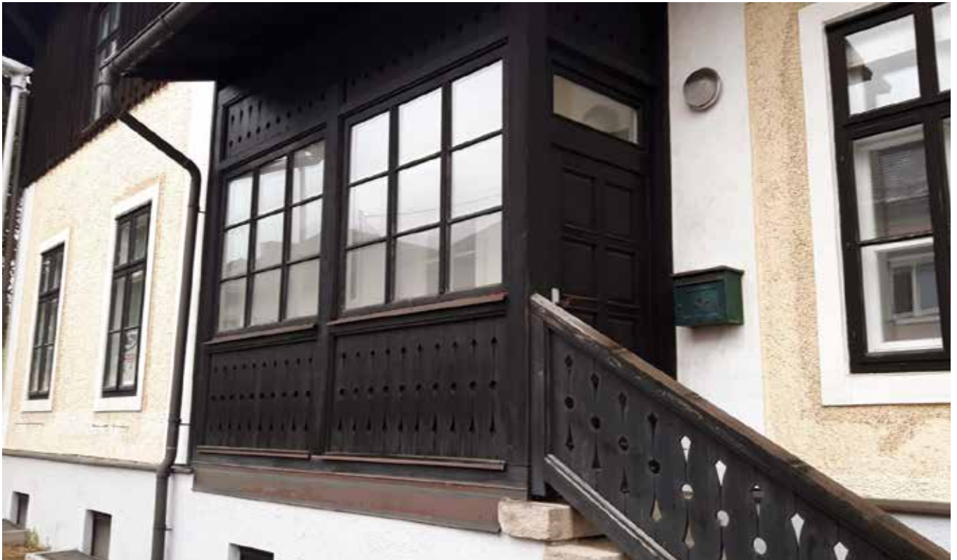
Ab 28. September gehts los mit dem neuen Dorfladen in Sandl

die Verantwortung für die Führung und Gestaltung übernommen. Wir wünschen alles Gute!