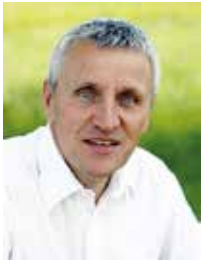
von Manfred Dreiling