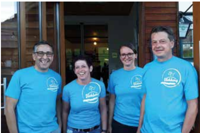
Das SPÖ Ausschuss-Team mit Verstärkung