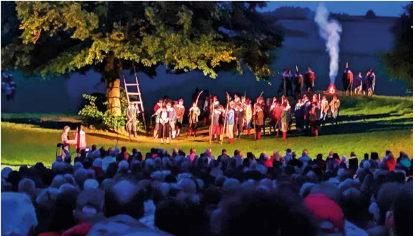
Beeindruckende Kulisse bei der Aufführung der „Frankenburger Würfelspiele“