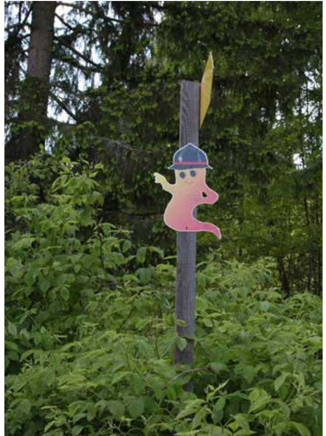
Wir erwandern den Feuerwehr-Wanderweg.

Unser Familienwandertag startet um 10 Uhr. Gemeinsam werden wir den Feuerwehrwanderweg mit den tollen Stationen bewandern und anschließend gemütlich am Spielplatz in Sandl beim Lagerfeuer Würstel grillen. Wir freuen uns auf einen gemütlichen Tag zusammen.