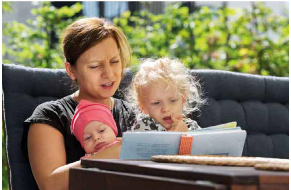
Karenzzeiten werden nun endlich voll angerechnet.

Für unsere Vorsitzende Pamela Rendi-Wagner ist die volle Anrechnung der Karenzzeiten „eine wichtige Verbesserung für Frauen mit Kindern in Österreich und ein großer Schritt, um die Lohnschere zwischen Frauen und Männern zu schließen.“ Insgesamt steigt das Lebenseinkommen