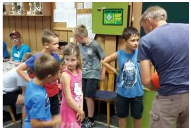
Nach einer kurzen Einschulung hatten alle Kinder sichtlich Spass an der Feriempassaktion des Kegelclubs.

In einer Pause konnten die Kinder auch die Funktionen der Technik im Maschinenraum kennen lernen. Mit Eis und Getränken wurde für eine willkommene und erfrischende Abkühlung gesorgt. Alle hatten großes Interesse und viel Spaß am gemeinsamen Spiel. Vielleicht hat der eine oder die andere auch tatsächlich eine Leidenschaft am Kegelsport entdeckt und wird in Zukunft noch als Meister von sich hören lassen.