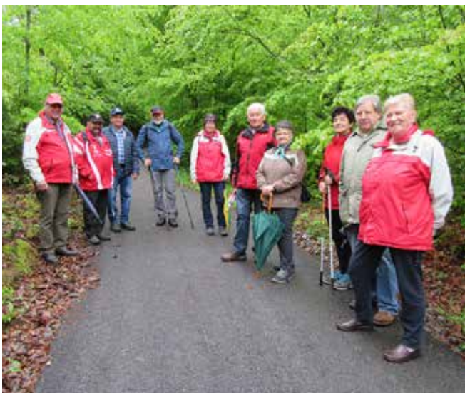
Fleißige Wanderer am Weg nach Mairspindt

Unser Frühjahrsausflug führte uns zum Königsee nach Bayern. 42 Personen nahmen daran teil und waren von der Schiffsfahrt zur Wallfahrtskapelle St. Bartholomä und dem restlichen Programm hellauf begeistert.