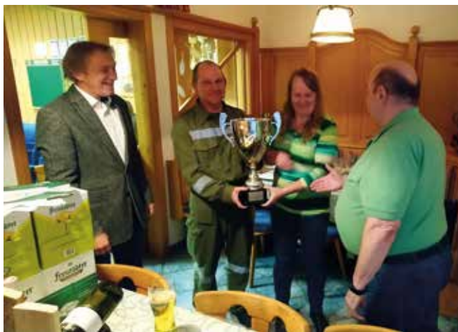
Der Sparverein Gugu ist neuer Ortsmeister 2019

Wir sind schon sehr gespannt und freuen uns auf neue Herausforderungen und Duelle bei der 22. Ortsmeisterschaft im kommenden Jahr.